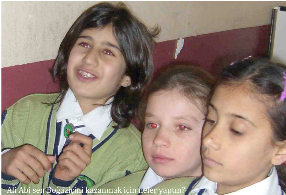
Ali Abi sen Boğaziçini kazanmak için neler yaptın?

Köyünde kalan... Hatta maalesef intihar da eden..."