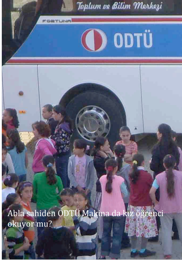
Abla sahiden ODTÜ Makina da kız öğrenci okuyor mu?