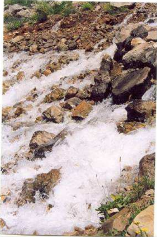
Çağlayan Munzur'un suyu mu, suda saklı sorular mı?

Bir gün yolunuz sarp dağlar, derin akarsu vadileri arasında kalmış Tunceli'ye düşerse, daha ilk adımlarınızda bir efsaneler kentinde olduğunuzu hemen anlarsınız... Ayaklarınız rüzgarın esintisinin peşinde Munzur çayını bulur önce. Kentin içinden geçen çayın kıyısında soluklanır, Munzur suyunda yetişen özel alabalık cinslerinin tadına bakmadan edemezsiniz. Hatta suyun sesi çağrı olur, hayatınızın belki de o günlerdeki temel sorularından biri "nereye" nin yanıtını bulacakmışçasına delicesine akan suyun izini sürmeye kalkarsınız... Suyun dolu