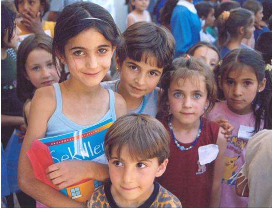
Etkinliklerden çıkan, armağan kitaplarını almış çocukların "gitmeyin" diyen bakışları...

Gözüm arka sıralarda oturan öğretmene takıldı ister istemez. Kıs kıs gülererek, göz kırpyordu bana.