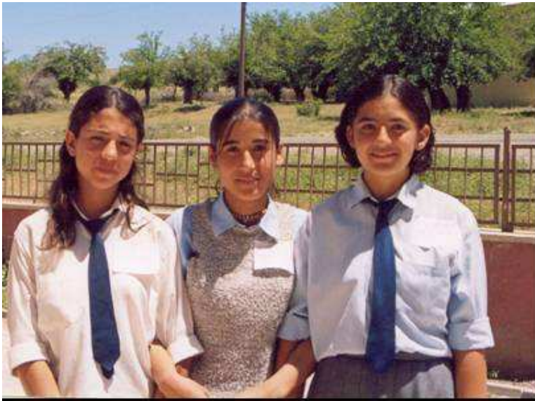
Mazgirt Göktepe'nin iyi bir geleceğe hazırlanan, soru sormayı seven kızları...

Pınarlar, 114 haneli bir köy. Yemyeşil. Gaziosmanpaşa İlköğretim okulunun 198 öğrencisinin 15'i ana sınıfı öğrencisi.