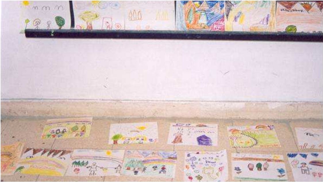
Bir ve ikinci sınıf ¼ğrencileri aldılar boyları ellerine. Kısacık G¼kkuşadıının Öyk¼s¼’ne istedikleri yerden katıldılar. Upuzun bir Resim-Öyk¼ ıktı ortaya.

Kız konuşurken üç¼nc¼ sınıfların Güzel Yazı Panosunda göz¼me takılan “İnsan insanın efendisi olamaz” yazısına, oradan da Tunceli meydanındaki İnsan Halkları Evrensel Bildirgesinin ilk maddesi özg¼rl¼k ve baęımsızlıęın simgelendięi heykel gurubuna gitti aklım.