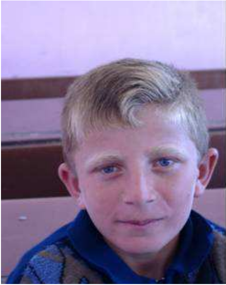
O bir güneş çocuğu. Güneş renklerini cömertçe boca etmiş yanaklarına, saçlarına.

“Zeka mekayla yaşantım değişmez... Okutmayacaklar beni, o kadar!”