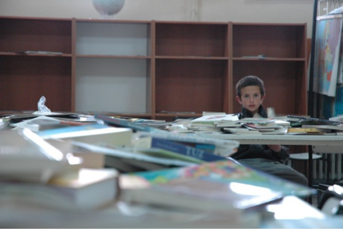
Boş raflar ve İLKİYAR'ın getirdiği yeni kitaplar....

Ziraat Bnk. ODTÜ Şb. (1537) 8970 324-5003 EUR -- IBAN:TR10 0001 0015 3708 9703 245003 EUR